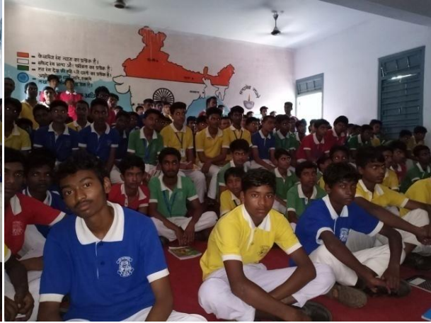
St. Joseph's High School, Kanke