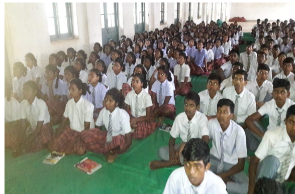
St. John's High School, Nawatarn