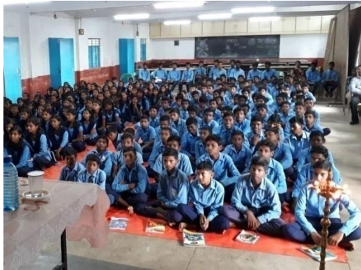
Gabriel's High School, Dhawaiya